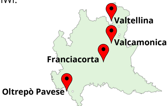
Localizzazione dei vigneti di confronto varietale

Visite guidate in aziende lombarde che coltivano PIWI.